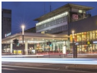
"Antänzer" bei Taschendiebstahl am Essener Hbf gefasst | WAZ.de