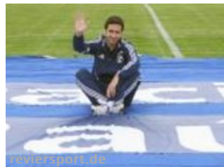
Schalke: Ex-Profi Raúl plagen große Schulden