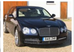
Video Bentley Flying Spur - 12 Zylinder...