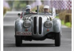
Oldtimer Ausflugstipps für Oldtimer-Fans