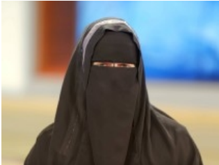
Bosbach empört: Anne Will lässt Vollverschleierte für Kriegseinsatz werben | WAZ.de