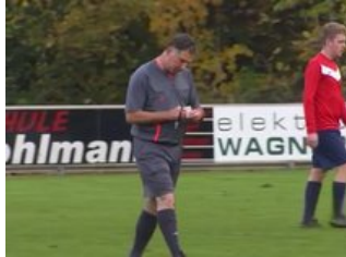
Von der WM in die bayerische Kreisklasse in...