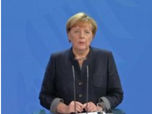
Merkel spricht von alarmierender Situation in...