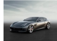
Fotostrecke Das sind die neuesten Sportwagen