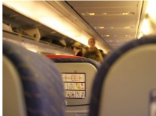
Rynair-Flugzeug muss wegen Schlägerei notlanden | WAZ.de