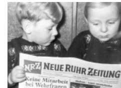
70 Jahre NRZ Die NRZ in den 50ern